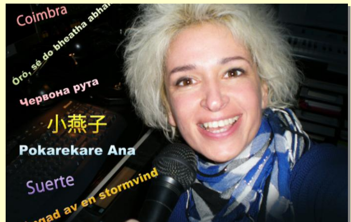
2015 steht ganz im Zeichen sprachlichen Vielfalt, denn die „SONNI World Songs“ sind rekordverdächtig.