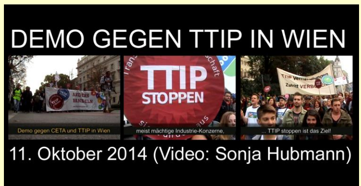
11. Oktober 2014 (Video: Sonja Hubmann)