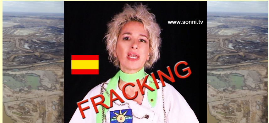
SONNI-ANSPRACHE AUF YOUTUBE „Fracking“:

„Fracking“ vergiftet und zerstört nicht nur fruchtbare Böden, sondern verseucht auch das Grundwasser. Millionen Liter Trinkwasser werden mit Chemikalien versetzt und tief ins Erdreich gepumpt – ein Irrsinn!